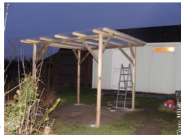
Grande Synthe : les douches

Les bénévoles se faisaient mouiller en attendant que les gars soient lavés et devaient laisser les vêtements propres dans les véhicules. La distribution s'en trouvait compliquée. Le mari de Sylvie (bénévole à Salam) et un de ses copains viennent de construire un abri. Bénévoles, migrants et vêtements vont être protégés. ■