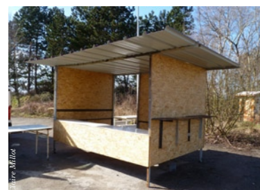
Tétéghem : point de distribution

A Grande-Synthe, c'est un container, oublié depuis des années sur le terrain, qui a été aménagé : nettoyé et repeint, un sol en ciment, deux grandes tables et deux bancs. Un grand espace est libéré pour que les gars puissent être